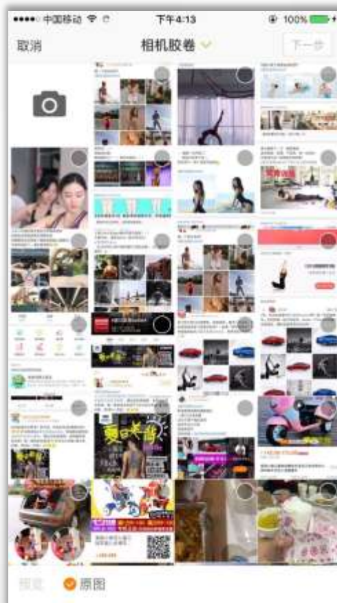
用户手机本地上传/拍照