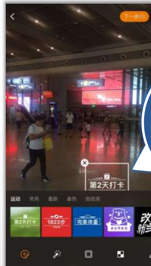
用户使用微博贴纸