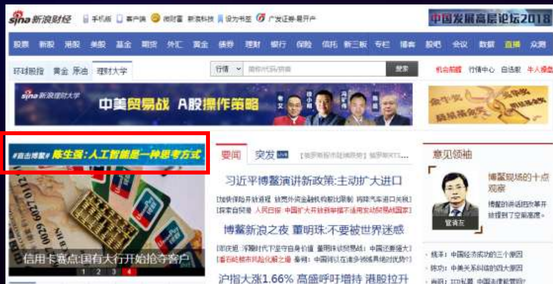
新浪网财经频道首页