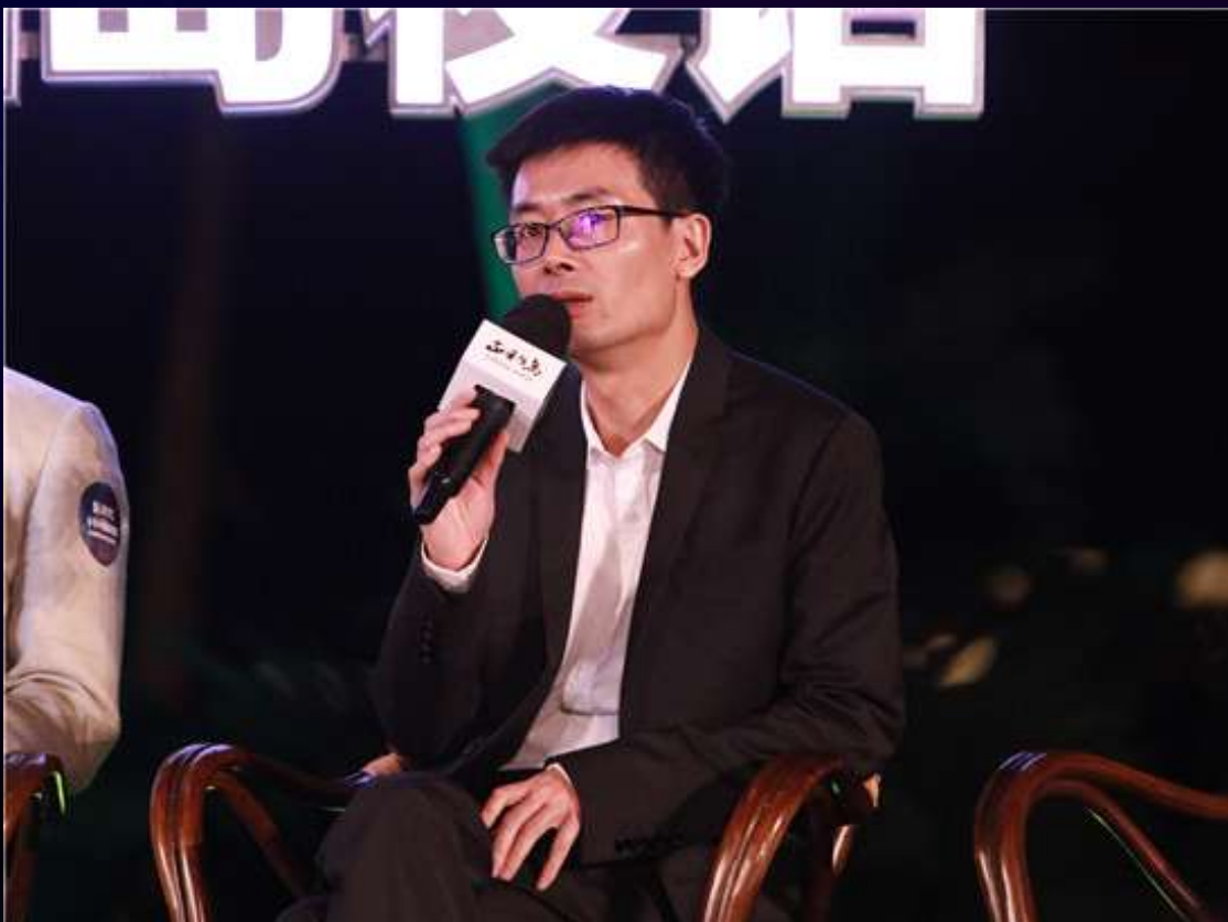
京东金融ceo陈强生 参加思想畅谈：新时代，中国新机遇环节演讲