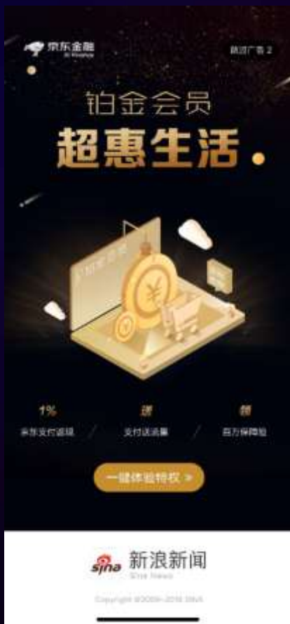
新浪新闻 开机报头9&10日