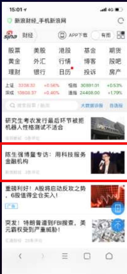
手机财经首页信息流