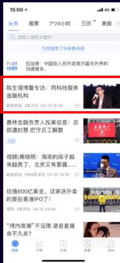
财经APP头条首页信息流