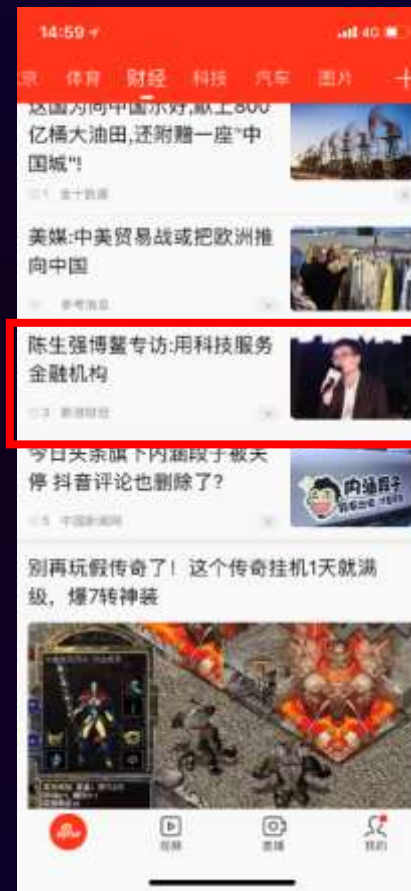
新闻app财经首页 信息流