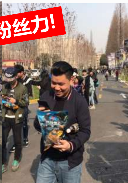
观众拿到鸡 正在分享喜悦