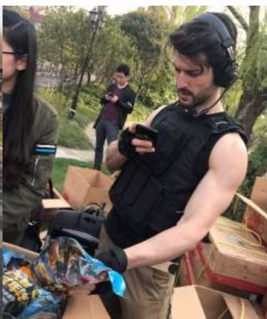
外国友人主动直播 将活动分享至国际