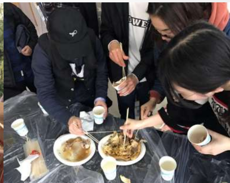
众观众迫不及待 品尝温氏鸡