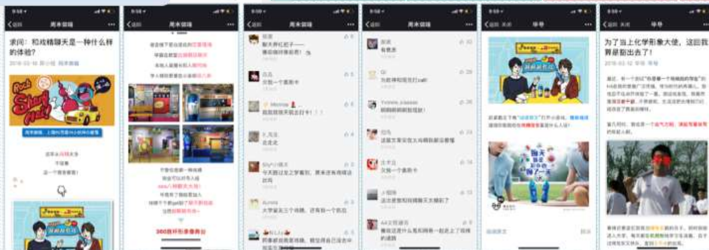
本地活动大号：周末做啥