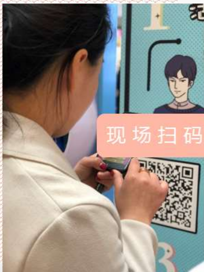
现场扫码进行人设测试