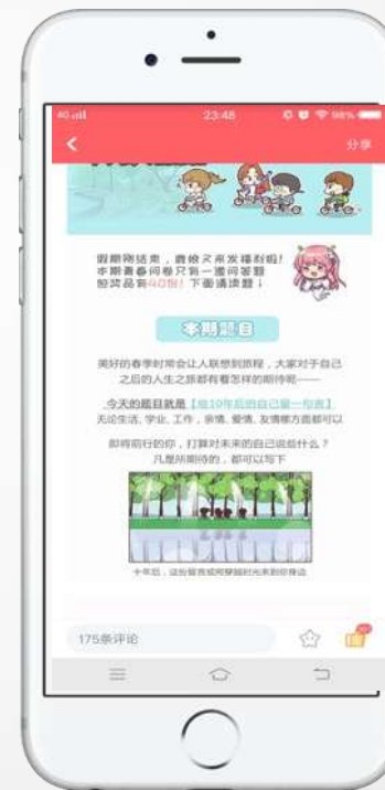
网易漫画 话题页活动