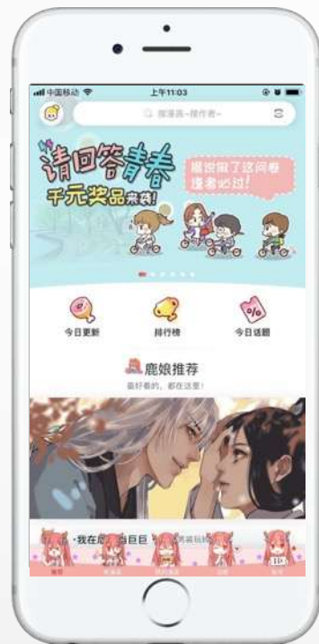
网易漫画首页 banner第一帧