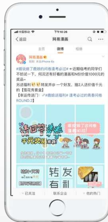
网易漫画微博 《请回答青春》活动