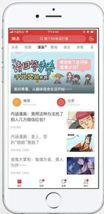
网易新闻漫画频道 首页banner第一帧