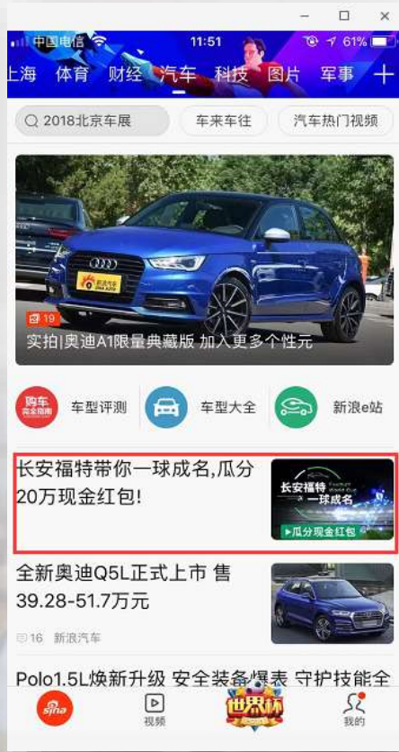
汽车首页信息流推荐