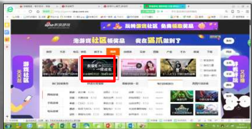
视频推荐（图片+文字）