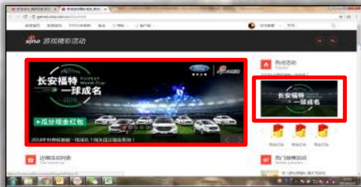
活动二级页焦点图及热点活动