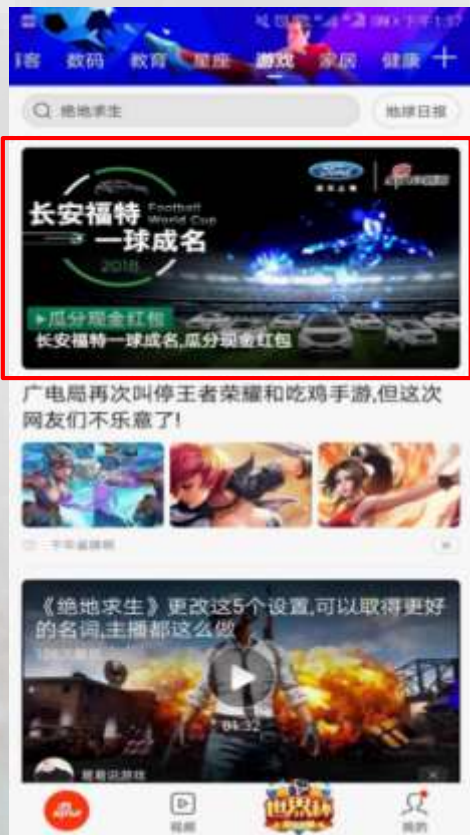
游戏标签头部焦点图