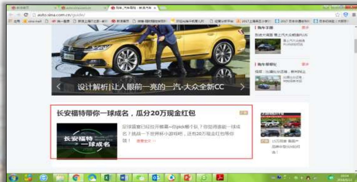
汽车频道导购首页信息流第一条