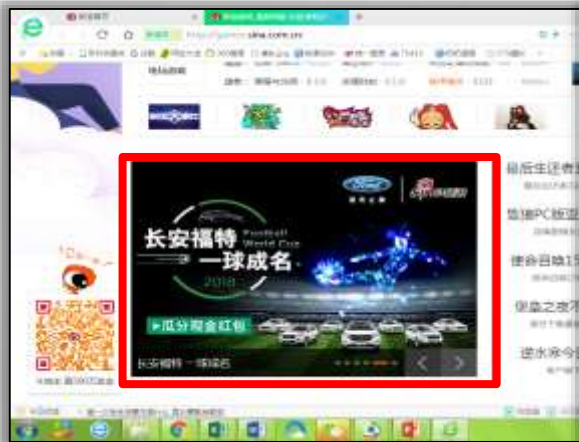
首页焦点图大幅推荐