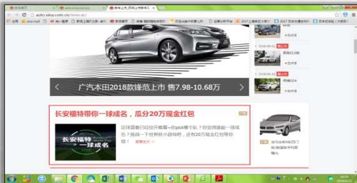
汽车频道新车首页/试车首页 信息流第一条