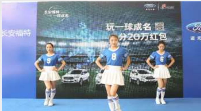
舞蹈表演，炒热现场气氛