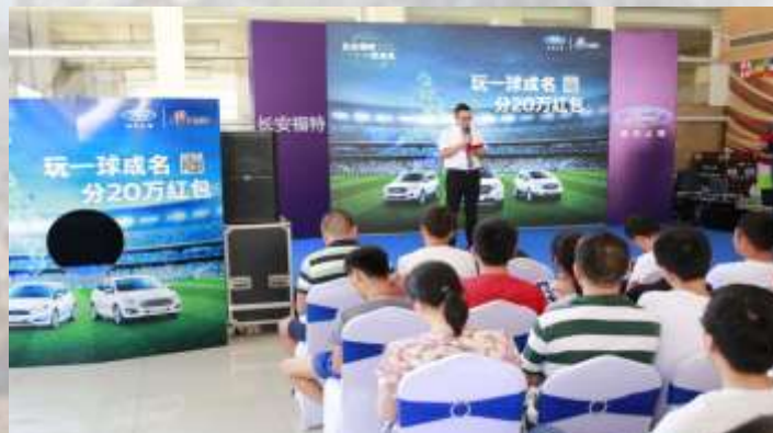
车型亮点、优惠政策讲解