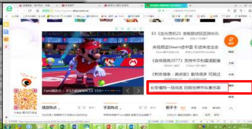
首页头条文字链推荐