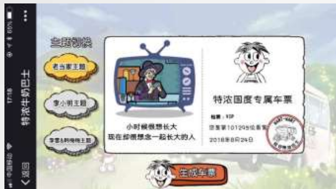
选择车票主题 生成车票