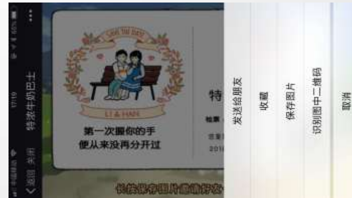
长按保存车票 引导用户分享