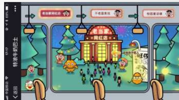
车内场景，引导点击进入 主场景寻找特浓车票碎片