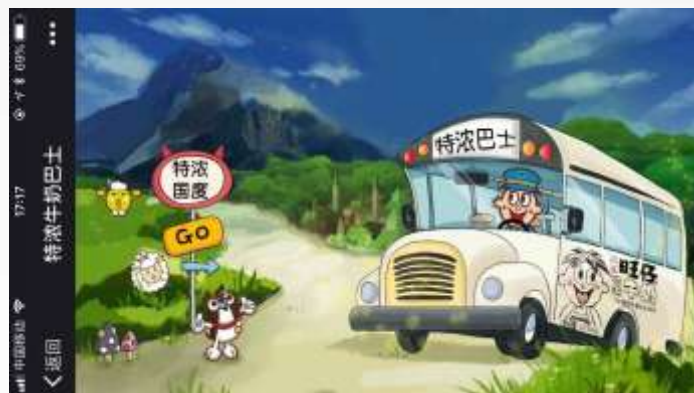
主界面 特浓巴士开往特浓国度