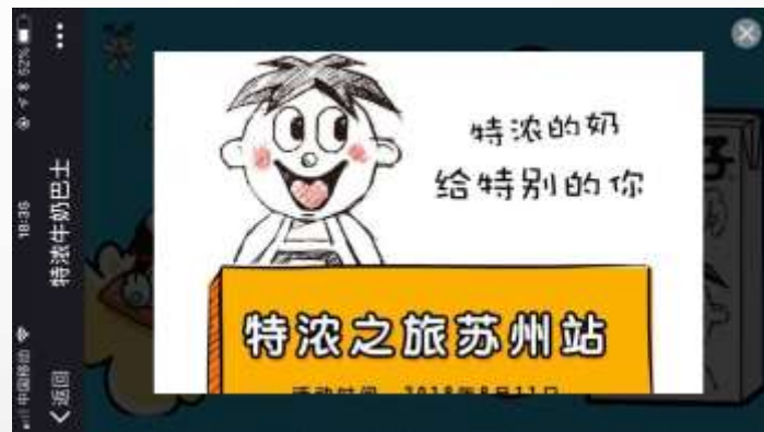
返回H5 预告线下特浓之旅活动