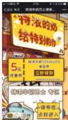
电商界面 领取优惠券