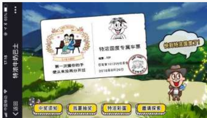
生成车票界面 引导抽奖