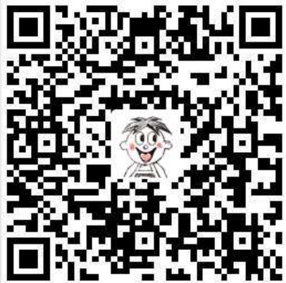
扫码体验 旺仔特浓巴士H5