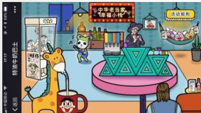
主场景A：中华老当家网红店， 在其中点击寻找 特浓车票碎片