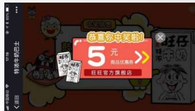
抽奖页面获取奖品 引导外链电商