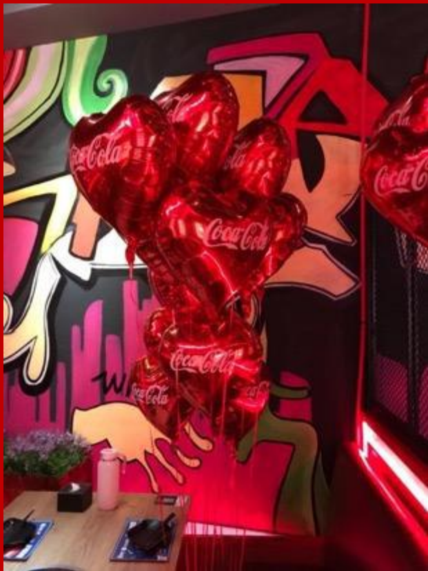
可口可乐线下主题火锅店