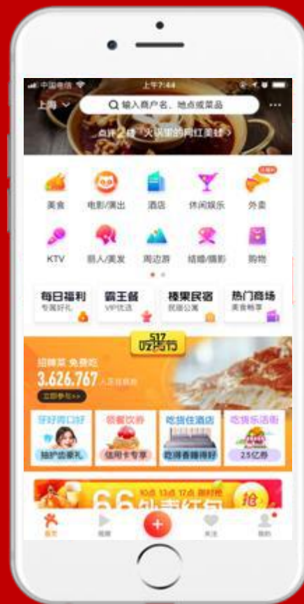
点评首页点评二楼