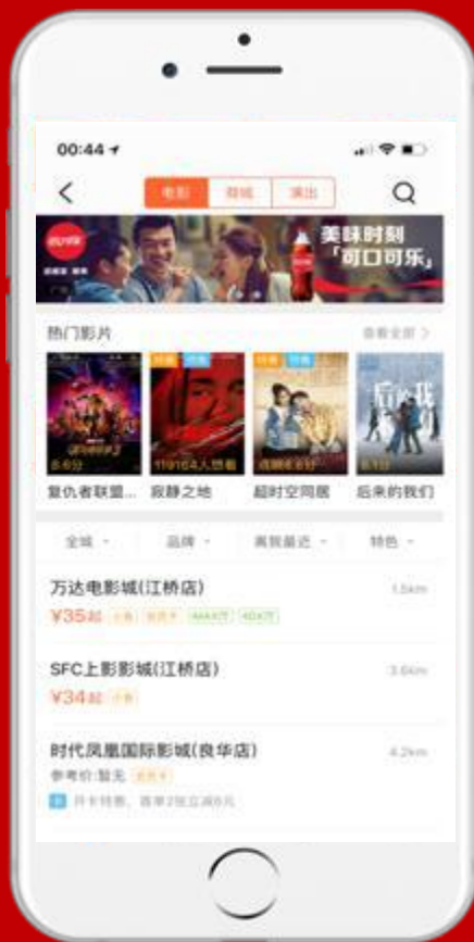
点评电影频道首页