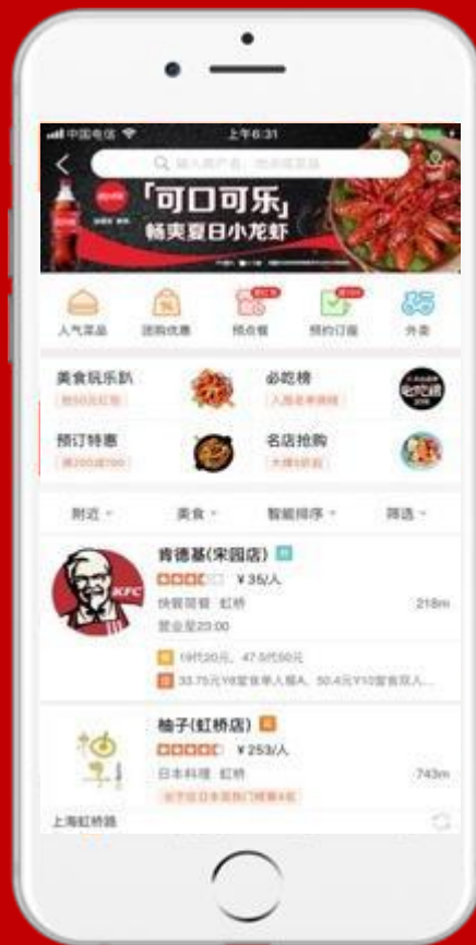
点评美食频道顶通