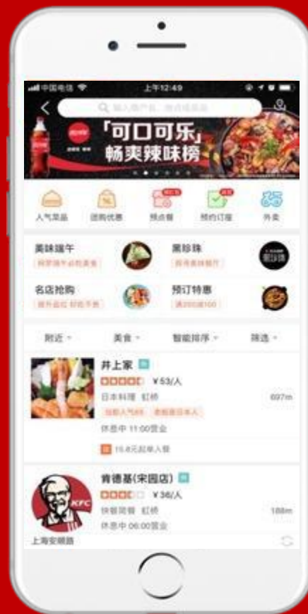
点评美食频道首页