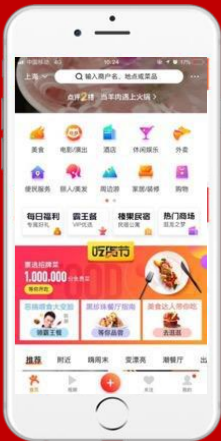
吃货节可口可乐入口