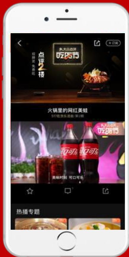
点评二楼视频植入