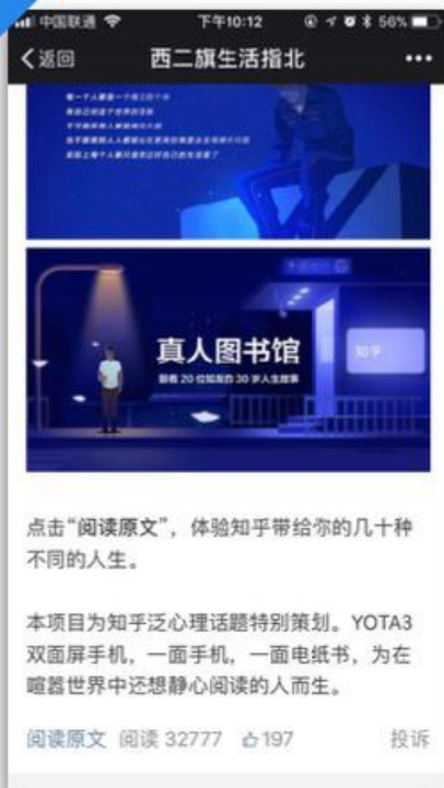
西二旗生活指北 阅读量 32777