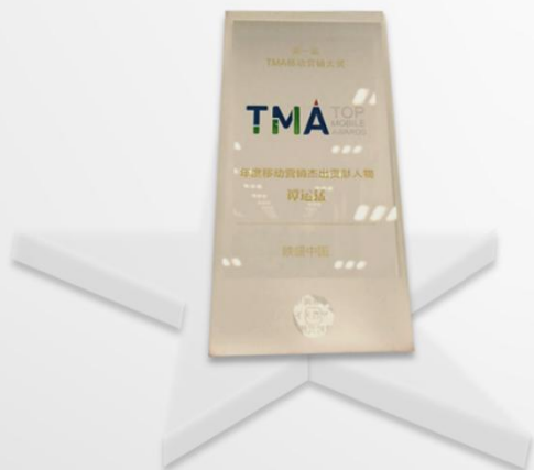
TMA2014年度移动营销杰出贡献人物