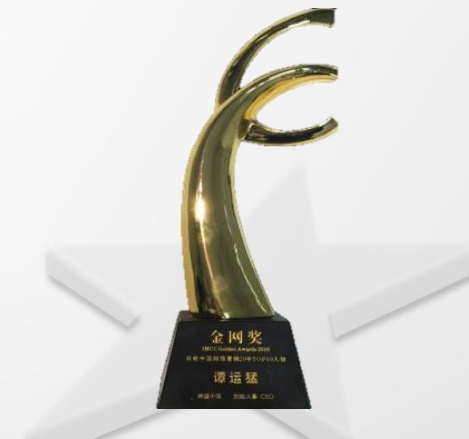
2016年度网络营销20周年top60人物榜