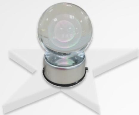
2012年度AD100中国网络广告百名风云人物