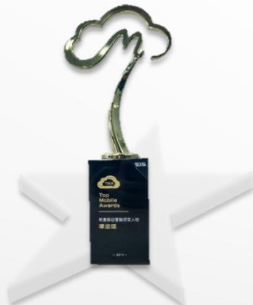
2015年度TMA年度移动领军人物