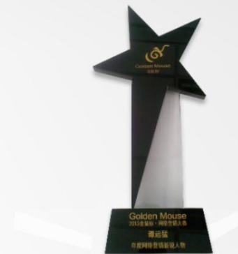
第四届金网奖2013年度网络营销新锐人物