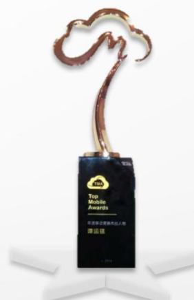
TMA2016年度移动营销杰出人物