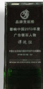
影响中国2013年度广告领军人物