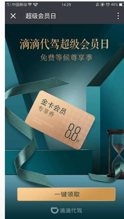
活动详情展示 刺激用户参与