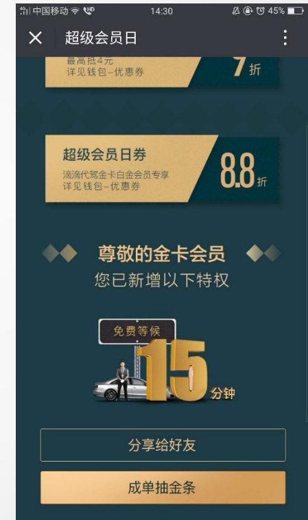
活动分享 扩大影响力