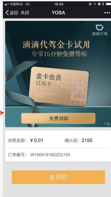
支付完成，滴滴代驾活动曝光 广泛吸引眼球