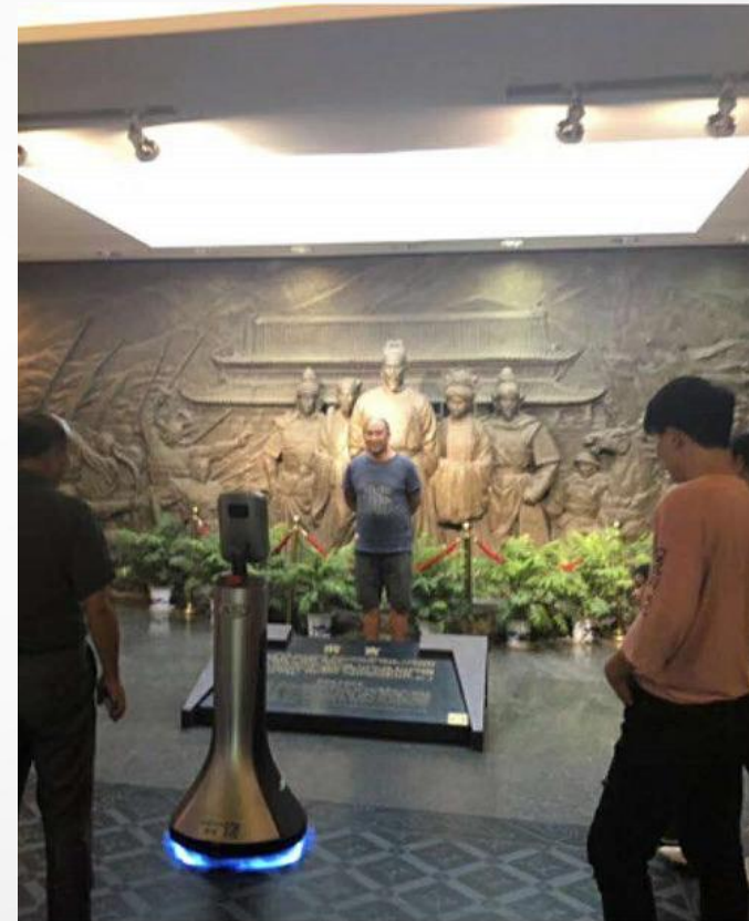
图：豹小秘导览机器人在八达岭长城进行游客接待服务