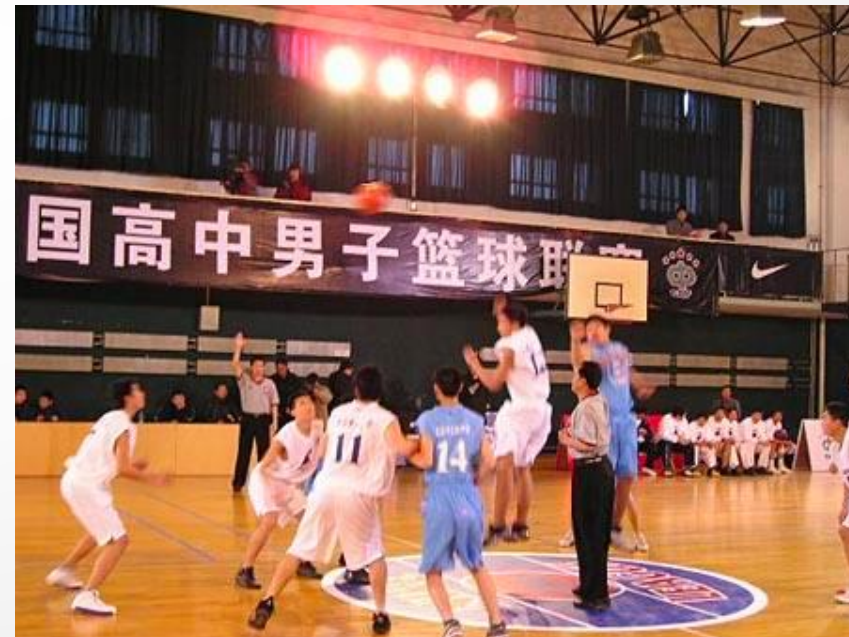
图为2015赛季比赛现场