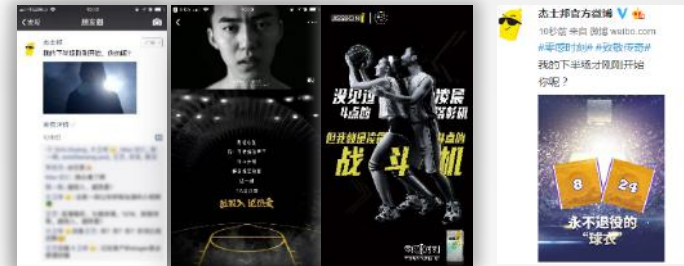
朋友圈广告互动效果 总互动点击率、点赞率、评论率均为行业均值3倍以上