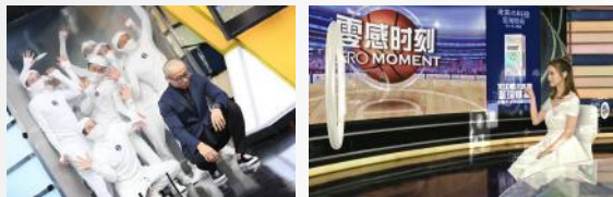
首个合作NBA创意中插客户