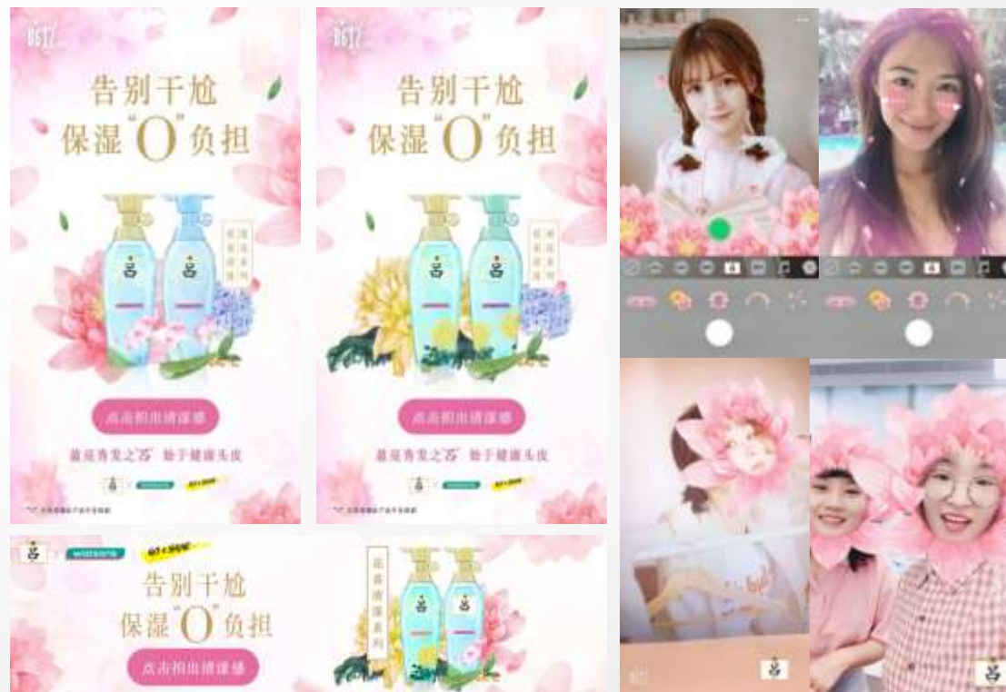
B612物料：开屏广告、通栏广告、自拍贴纸