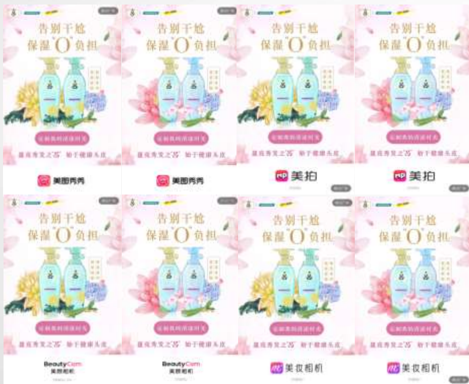
美图物料：开屏广告