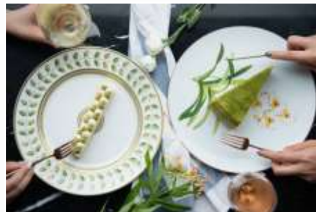
用有机蔬菜打造的“有机有爱餐”