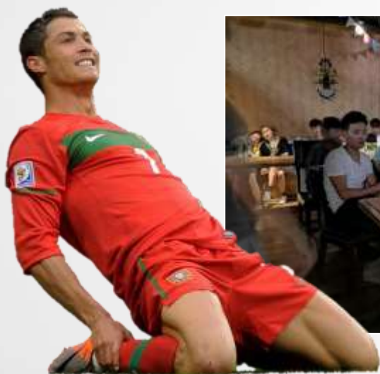
世界杯开始时刻，男性聚在一起看球赛