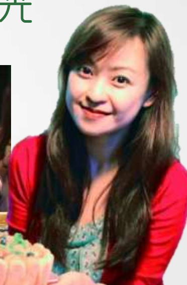
以金典牛奶作为芝士蛋糕原料，制作关爱芝士蛋糕，简单上手，材料，潜在为用户种草。制作时间恰好为一场球时间。邀请金典烘焙导师教授课程