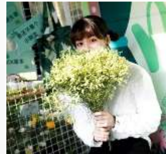
放置有机拍照道具