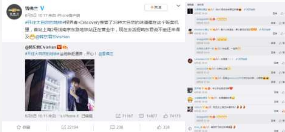
转发韩东君微博，立获粉丝刷屏转发，吸引超2W转发，创官博新高