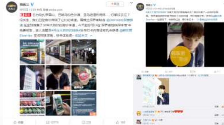
紧跟热度，再发互动微博，吸引粉丝打卡，为线下引流