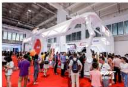
(图为大猩猩咖啡的咖啡吧台)

8月15日,猎豹移动携旗下猎户星空人工智能公司正式亮相2018世界机器人大会。猎豹旗下多款机器人产品——全球首款五星级接待服务机器人豹小秘、自动贩卖机豹小贩、基于猎户机械臂平台的豹咖啡及“七轴”服务机械臂 xArm7以及小豹AI音箱、小豹AI翻译棒,悉数现身。展会现场,参观者们还可以品尝到一杯由机械臂制作的限量版luckin coffee大师拿铁。