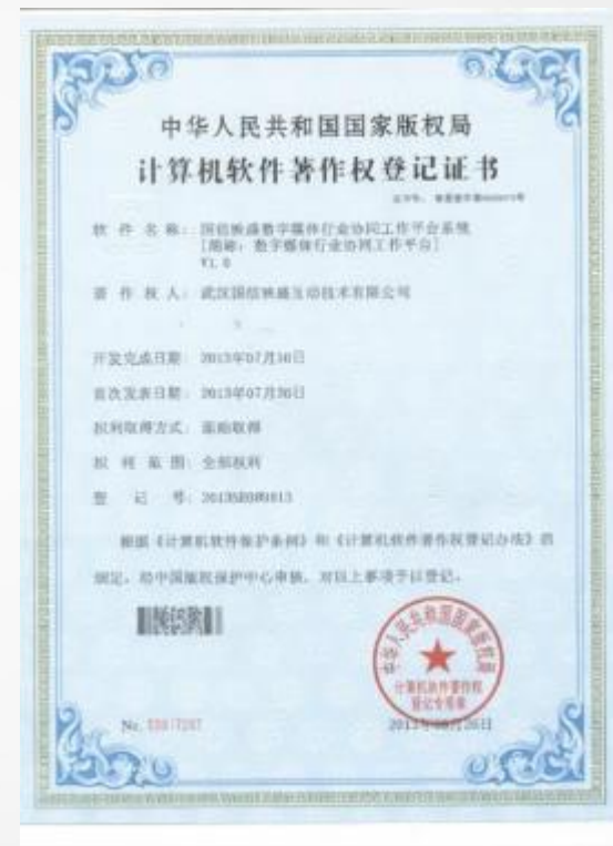
映盛数字媒体行业协同工作平台系统