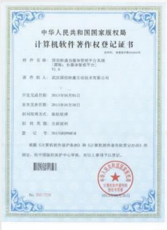
映盛自媒体管理平台系统