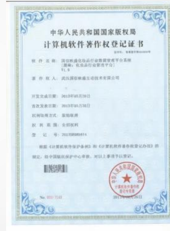
映盛化妆品行业数据管理平台系统