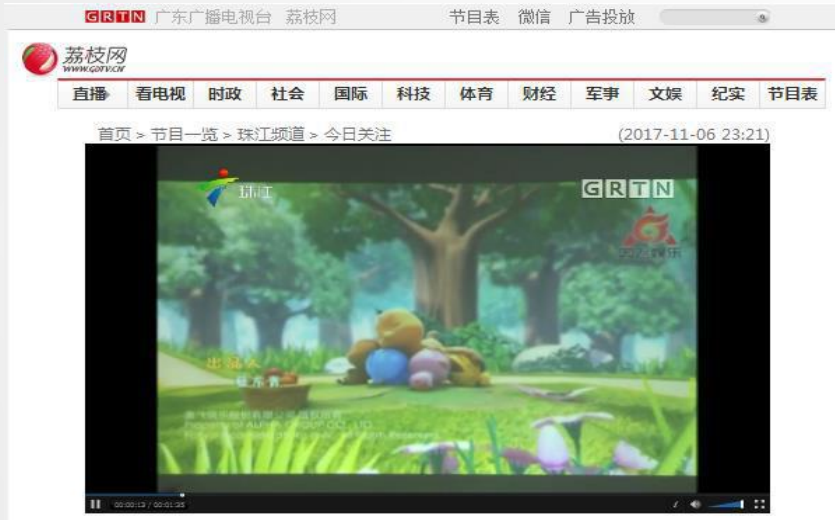
广东电视台《今日关注》1分35秒 及嘉佳卡通《嗨，小喇叭》3分钟报道 覆盖 超过500万 亲子家庭