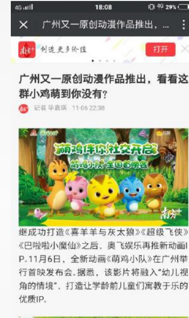
网易等大型门户网站以及 超过15家 网络媒体发布转载了萌鸡小队的相关信息