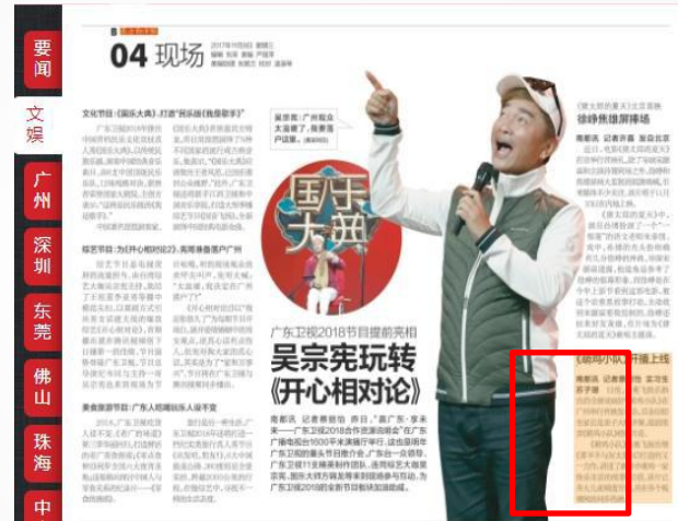
广东权威传统媒体均报道了本 次活动，累计覆盖超过 400万人 次