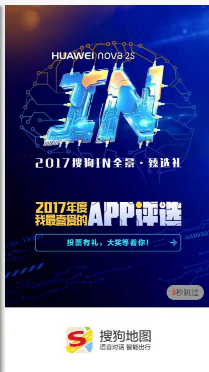
搜狗地图开屏广告