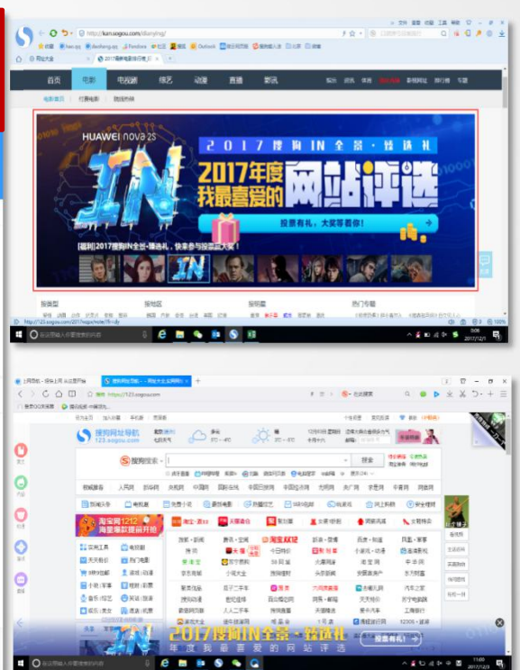
网址导航频道焦点图、浮层广告