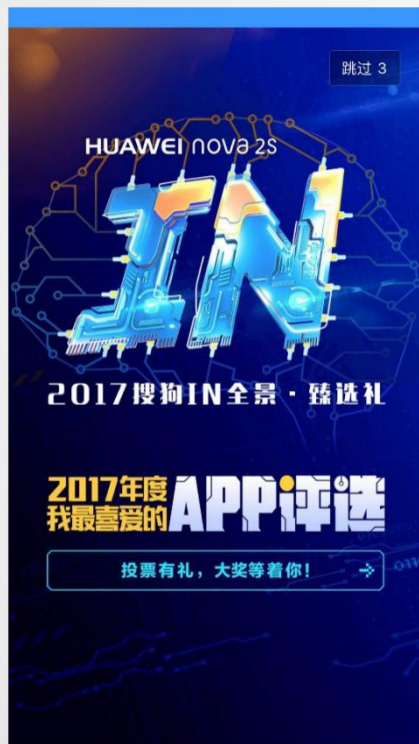
搜狗手机浏览器开屏广告