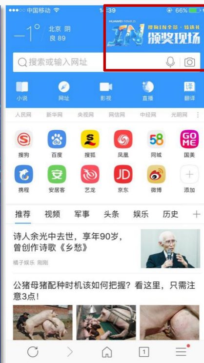
浏览器首页头图广告