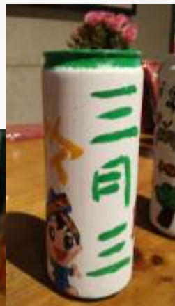
城市罐主题手绘活动