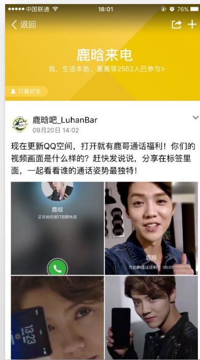
鹿晗粉丝社区-品牌互动告知