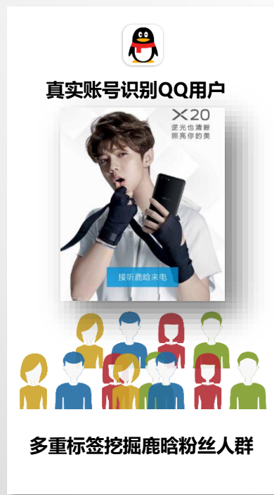
腾讯大数据圈中鹿晗粉丝人群