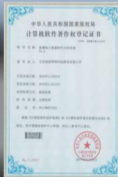
新媒体大数据分析系统