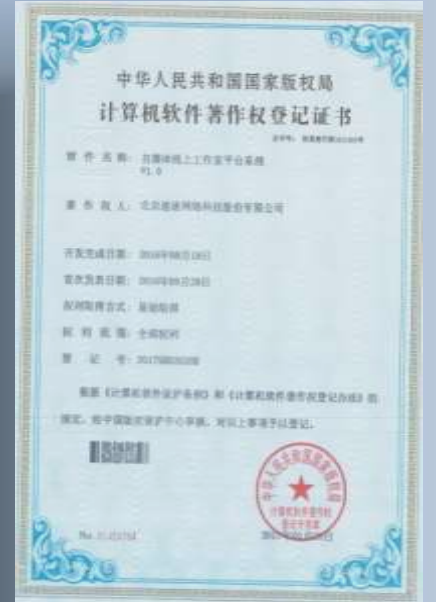
自媒体线上平台工作系统