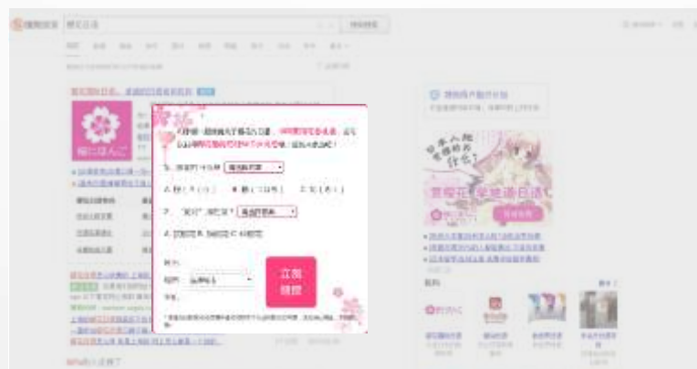
樱花节的浮层品专