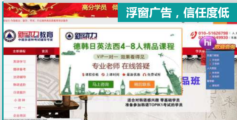
浮窗广告，信任度低

面对市场上纷繁冗杂的宣传方式，我们发现自嗨式宣传、没有针对性的推广，对于大多数用户来说感到反感！