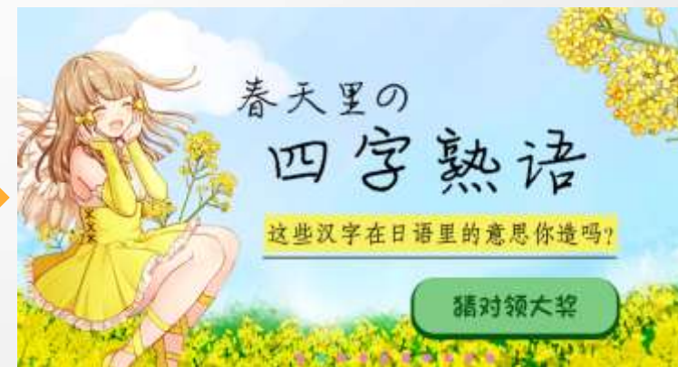
进入相关的活动页面，通过互动游戏，提高用户留存率