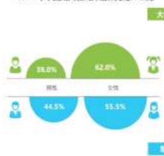
2017年中国成人在线外语教育用户性别