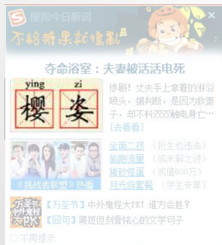
田字格板块植入“樱姿”热词