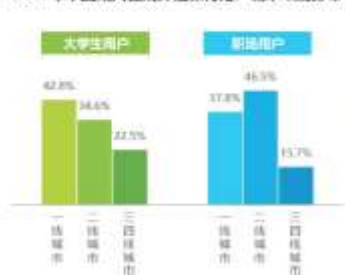
2017年中国成人在线外语教育用户城市级别分布